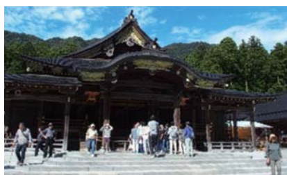
あいづしくみ年金友の会 ◆10月7日(火) 秋の寺泊海岸つわぶき温泉と海鮮日帰りの旅