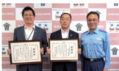
◆8月7日(木) 会津若松警察署より「なりすまし詐欺 被害未然防止にかかる感謝状」を拝受