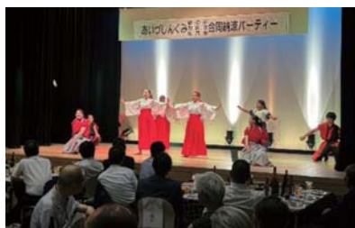
あいづしくみ蔵の会・皐月会・親和会 ◆7月10日(木) 納涼パーティー