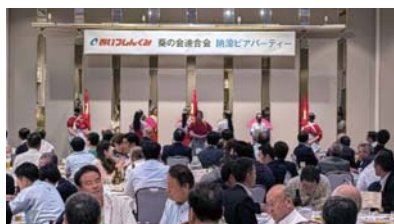
あいづしくみ葵の会 ◆7月24日(木) 納涼ビアパーティー * 上記のほか各支部でも活動しています。