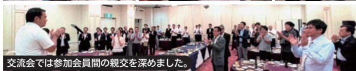
交流会では参加会員間の親交を深めました。