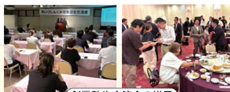
創業塾生交流会の様子