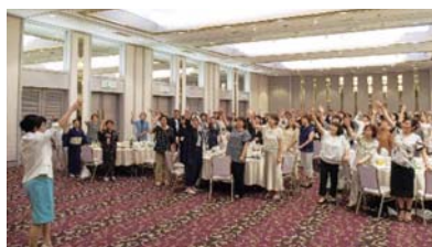
あいづしくみレディース城の会 ◆7月17日(木) 納涼パーティー * 上記のほか各支部でも活動しています。