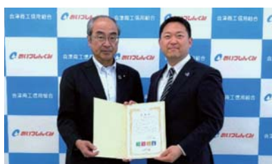
◆5月20日(火) 荒川産業株式会社より「ペットボトル キャップ寄付にかかる感謝状」を拝受