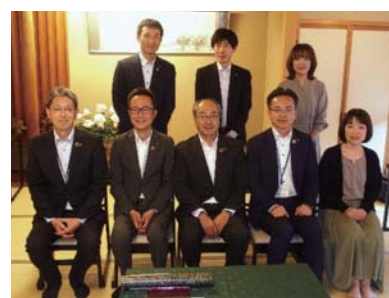
◆6月12日(木) 永年勤続表彰