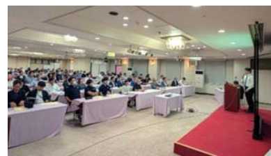
あいづしくみビジネスクラブ ◆9月11日(木) セミナー&交流会