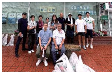
あいづしくみベンチャークラブ ◆8月2日(土) 清掃活動