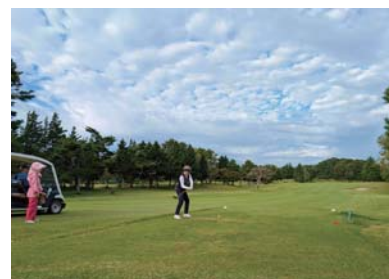
あいづしくみゴルフ会 ◆5月14日(水) 第128回コンペ ◆7月15日(火) 第129回コンペ ◆9月10日(水) 第130回コンペ ◆10月4日(土) 第131回コンペ 理事長杯