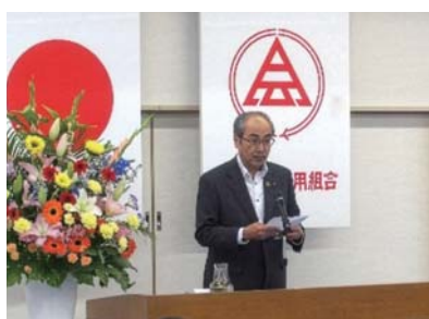
◆6月24日(火) 第69期通常総代会