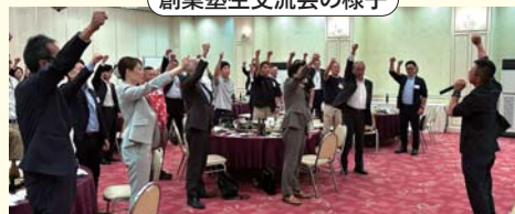
「あいづしんくみ創業塾生交流会」の開催

8月8日（金）創業者の人脈づくり支援の一環として第3回「あいづしんくみ創業塾生交流会」を開催しました。