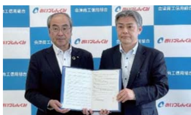
◆5月21日(水) 日本政策金融公庫と「危機事象発生に おける業務連携に関する覚書」を締結