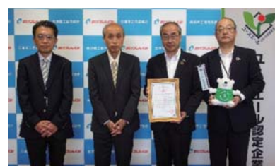
◆10月9日(木) 福島労働局より「ユースエール認定 企業5年連続証明書」を拝受