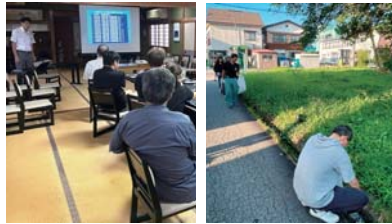
あいづしんくみベンチャークラブ ◆8月2日(金) 勉強会・懇親会 ◆8月3日(土) 奉仕活動