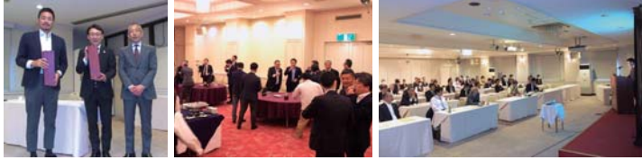
交流会では参加会員間の親交を深めました。

5月27日(月)、あいづしくみビジネスクラブ「第13回セミナー&交流会」をルネッサンス中の島で開催しました。