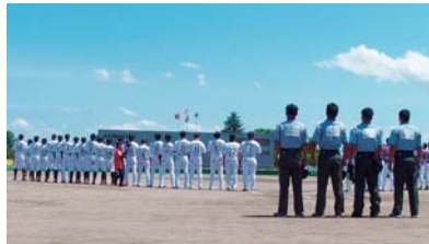
◆7月7日(日) 福島レッドホープスあいづしんくみ スペシャルマッチ