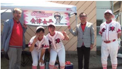
◆7月7日(日) 全会津中学校女子軟式野球選抜に テントを寄贈