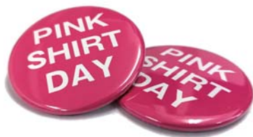
ピンクシャツデー運動 ◆4月24日(水) ◆6月26日(水) ◆8月28日(水) ◆10月30日(水)