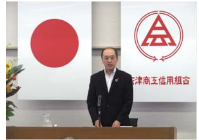
◆6月24日(月) 第68期通常総代会