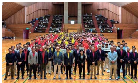
◆9月28日(土) 福島県信用組合協会体育大会