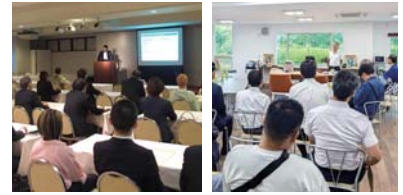
あいづしんくみビジネスクラブ ◆5月27日(月) 第13回セミナー&交流会 ◆9月10日(火) 研修視察