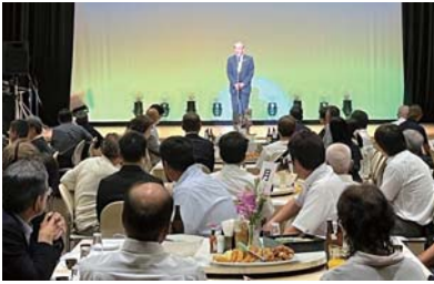
あいづしんくみ蔵の会・皐月会・親和会 ◆7月18日(木) 納涼パーティー