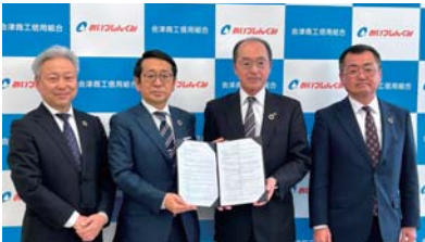
◆4月9日(火) ヒューレックスグループの人材紹介 に関する業務提携契約締結