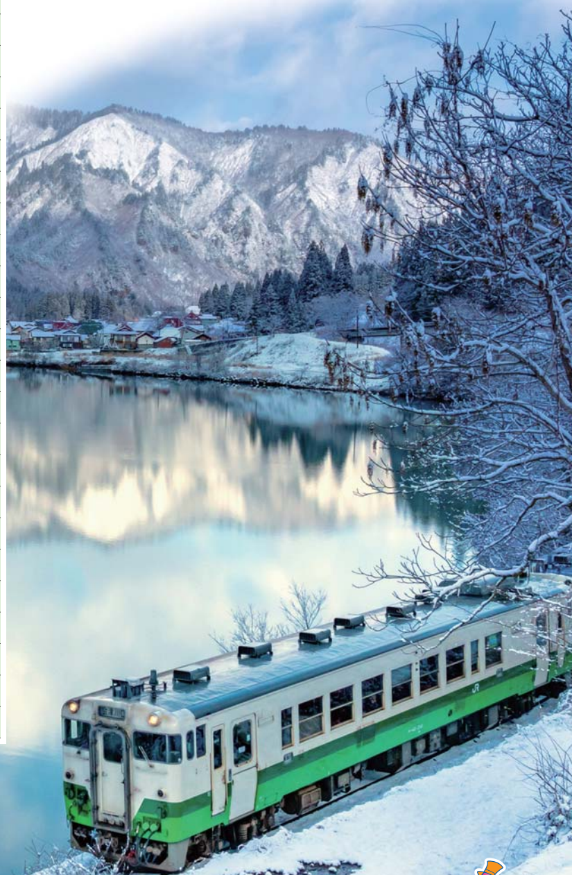
大志集落を走る冬の只見線(金山町)