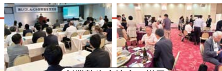
創業塾生交流会の様子