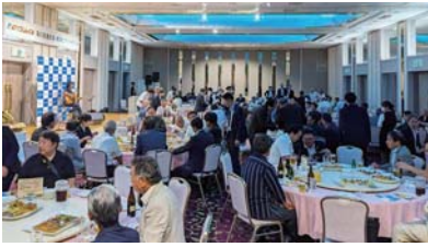
あいづしんくみ葵の会 ◆7月26日(金) 納涼ビアパーティー *上記のほか各支部でも活動しています。