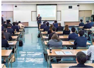
◆4月27日(土) コンプライアンス研修