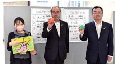
◆7月19日(金) 懸賞品付き定期積金ドリームプラス 公開抽選会