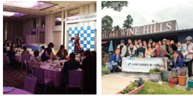
あいづしんくみレディース城の会 ◆7月11日(木) 納涼パーティー ◆10月29日(火) 企業見学会 *上記のほか各支部でも活動しています。